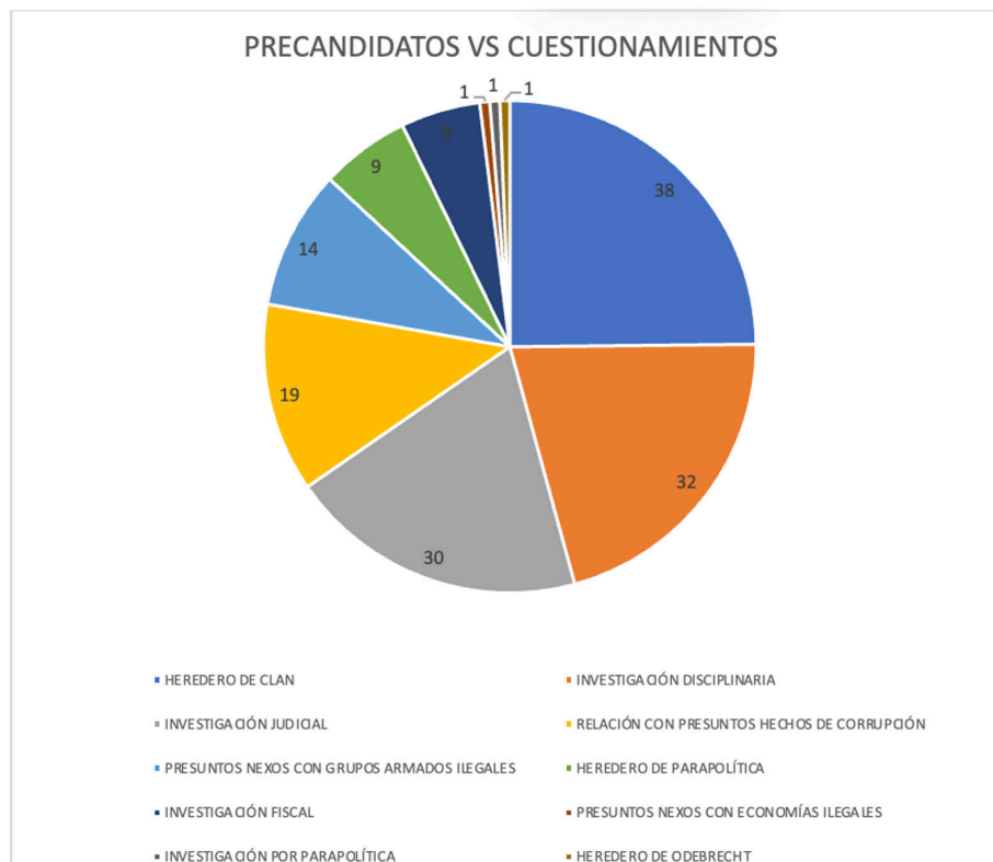
Gráfico No. 2. Tipos de cuestionamientos por precandidatos

Elaborado por: Línea Democracia y Gobernabilidad. Fundación Paz & Reconciliación (Pares).